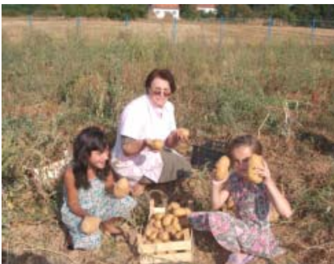
Freude über die reiche Frucht