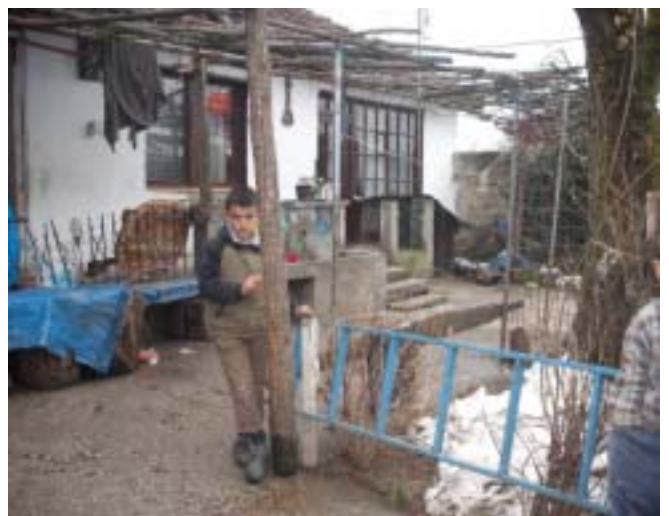
Die perspektive Losigkeit der Familie zeigt sich im Gesicht des Kindes